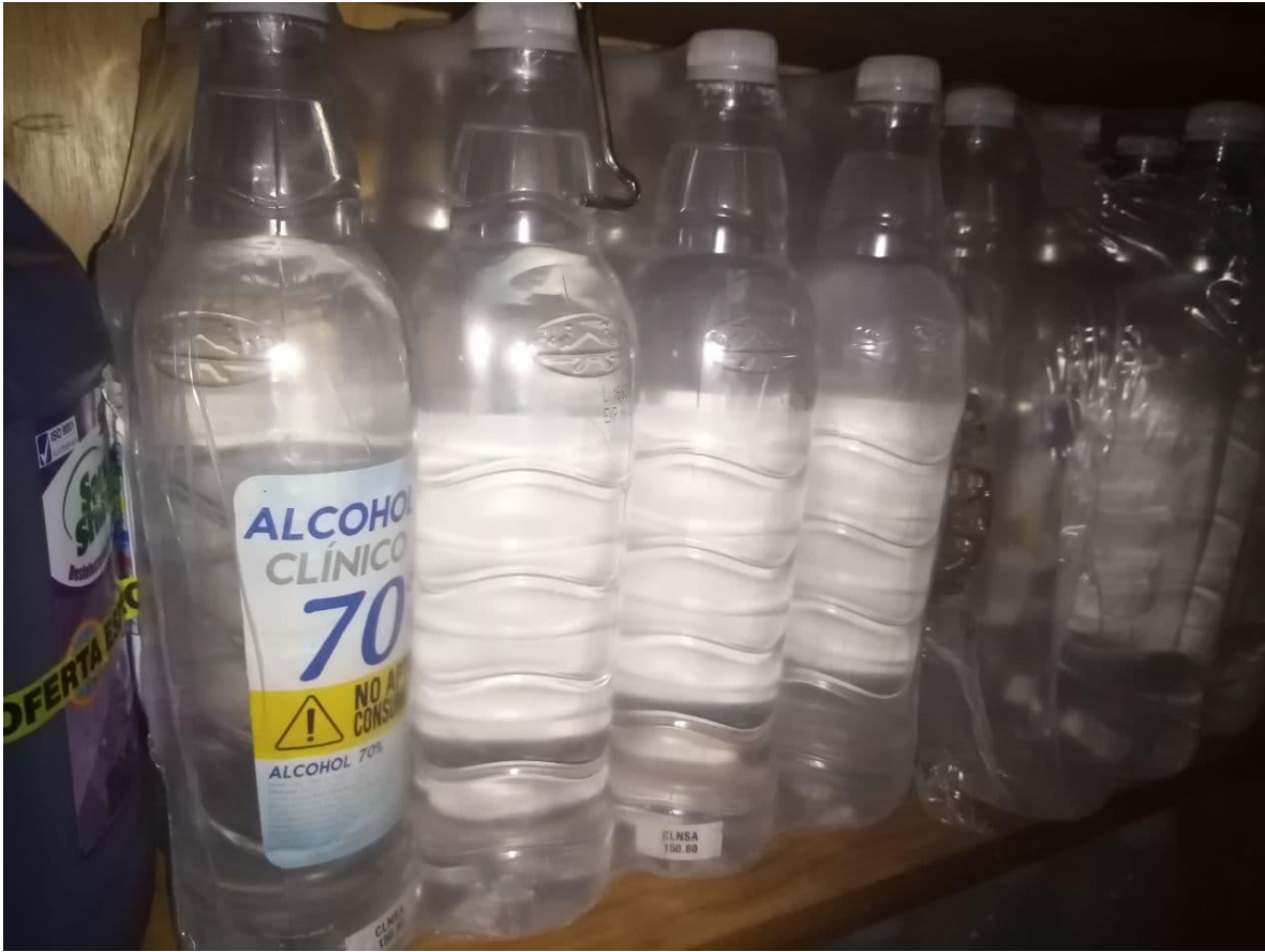
Ilustración 7: Alcohol al 70%