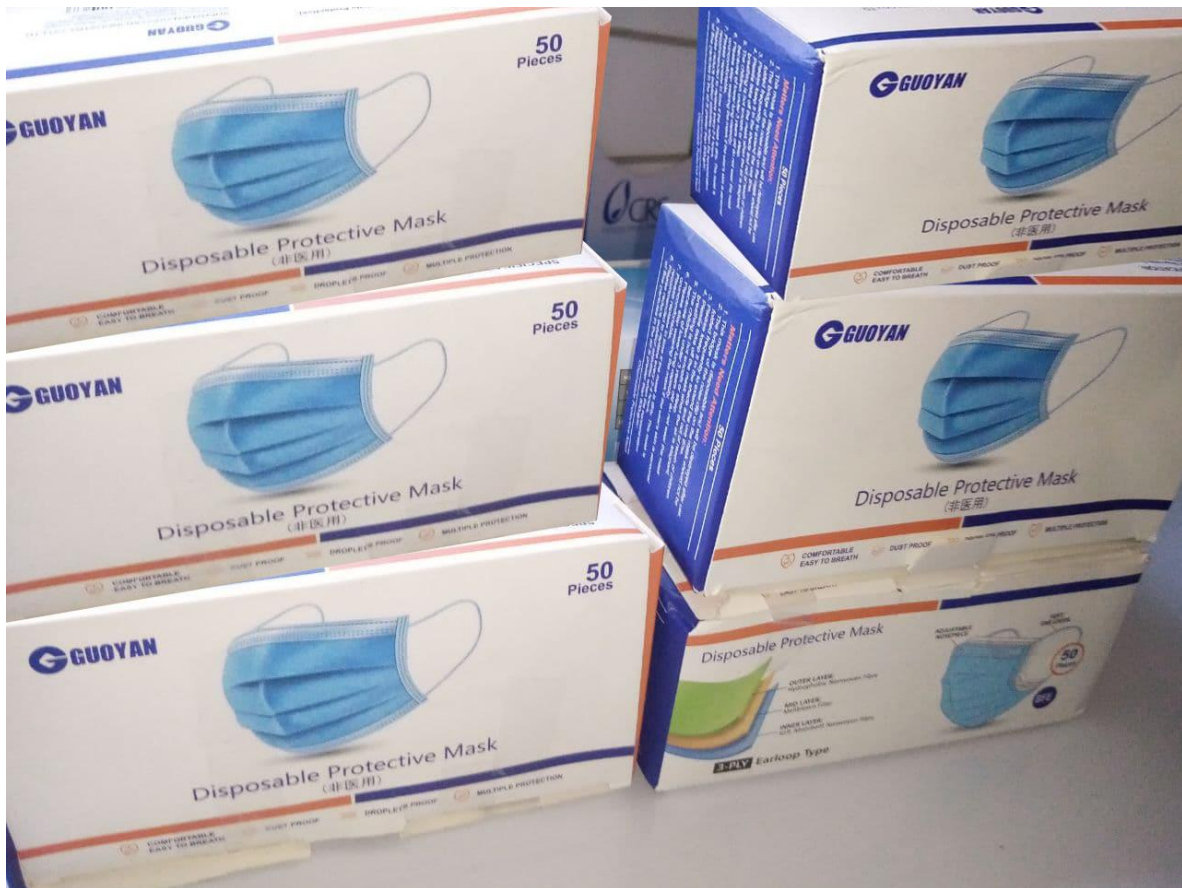
Ilustración 2: Mascarillas para adultos