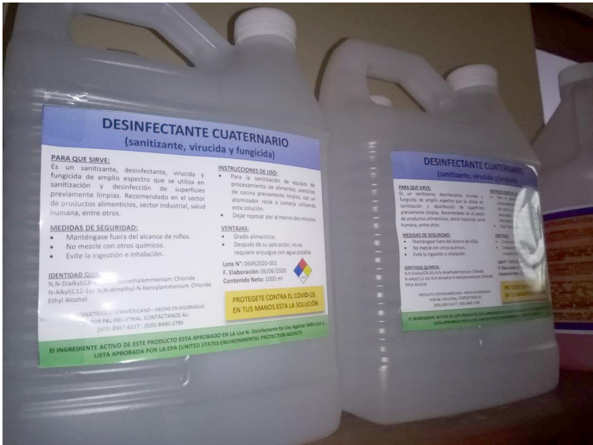
Ilustración 4: Cuaternario para desinfectar