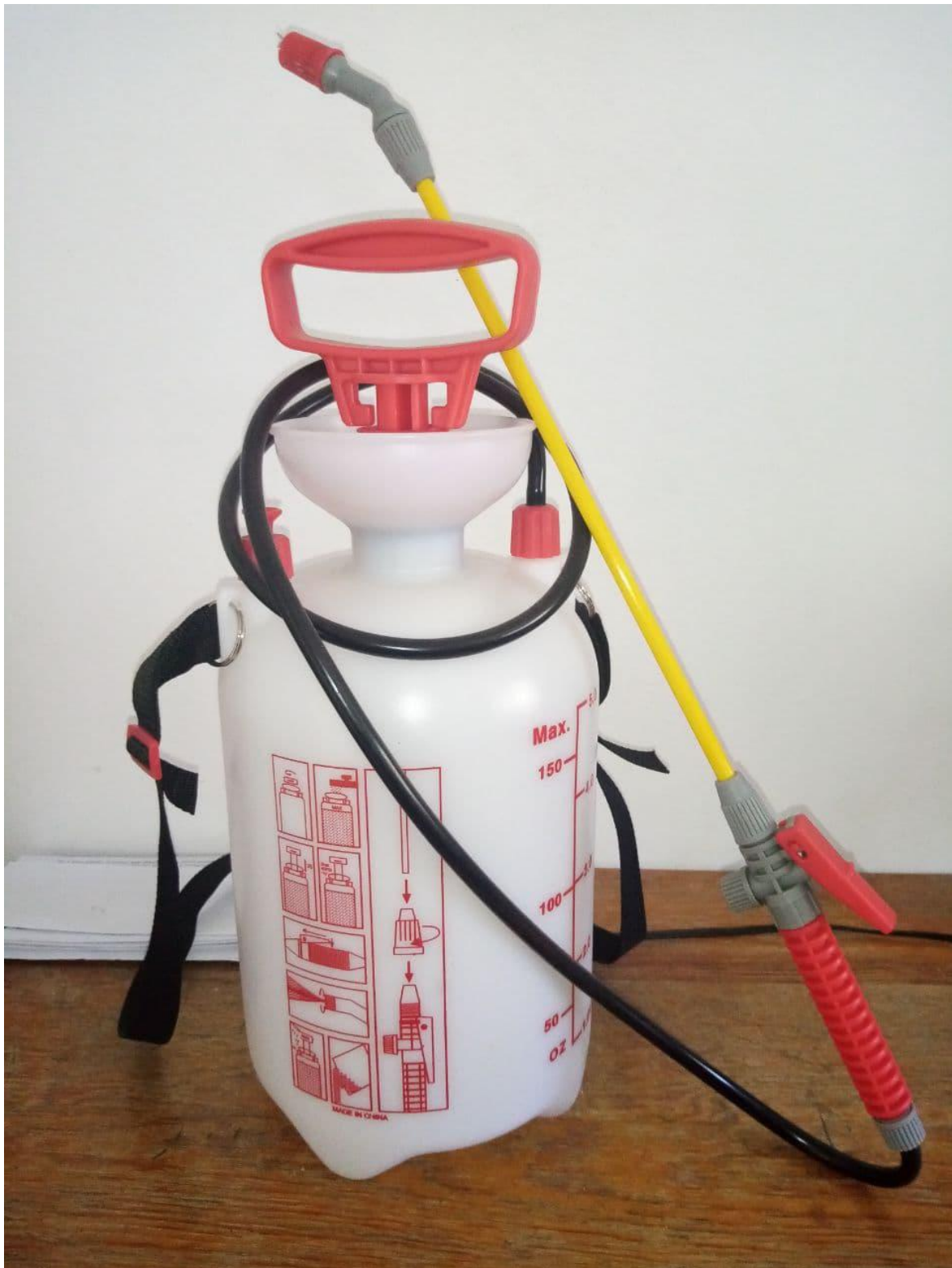
Ilustración 6: Bomba para fumigar áreas y espacios