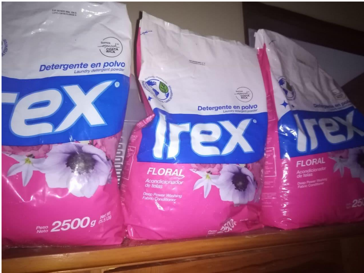
Ilustración 9: Detergentes