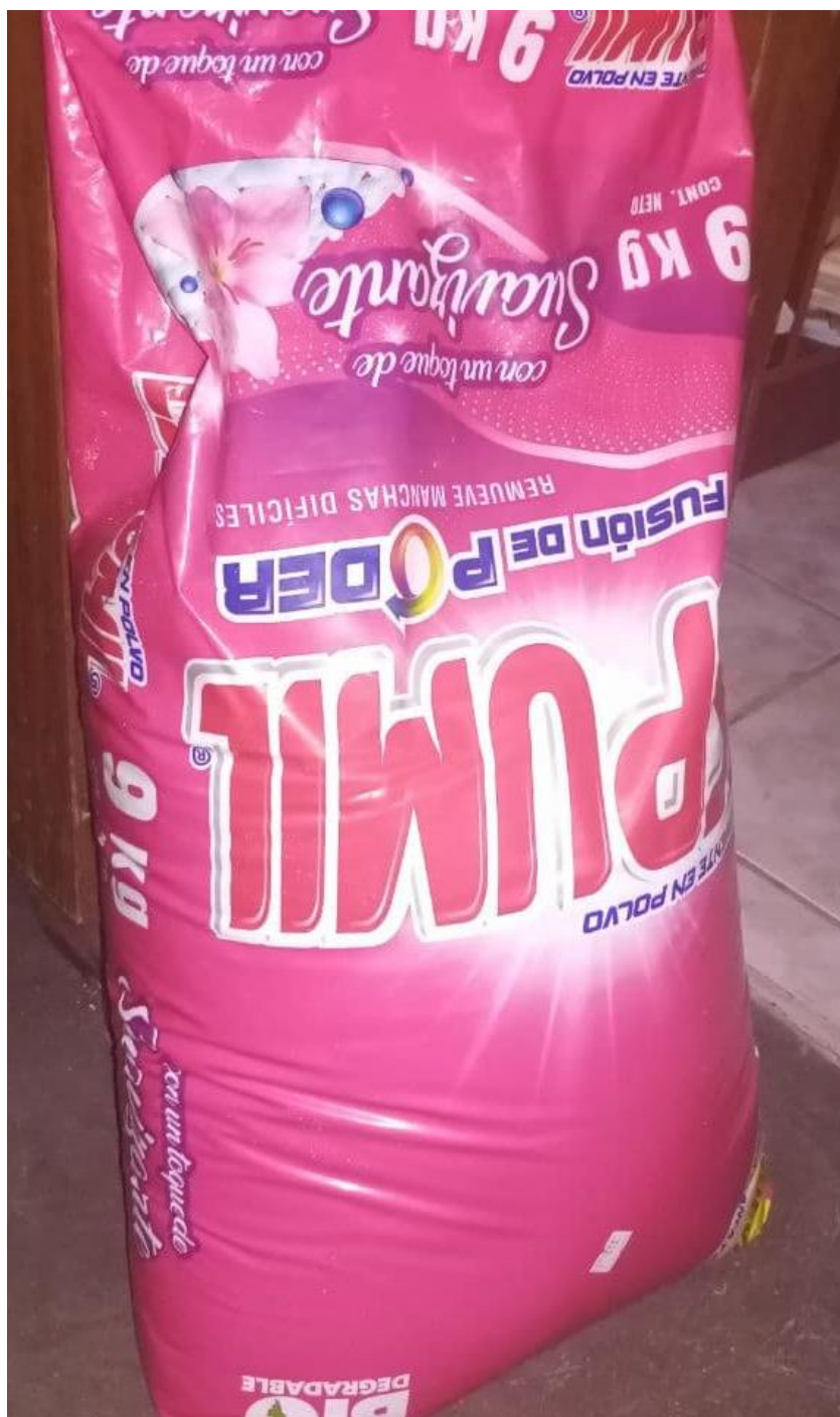
Ilustración 10: Detergente