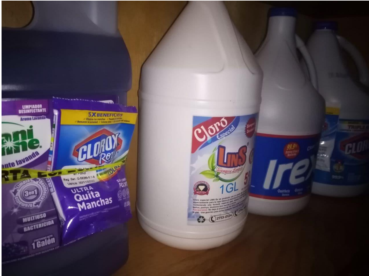
Ilustración 11: Desinfectantes y cloro