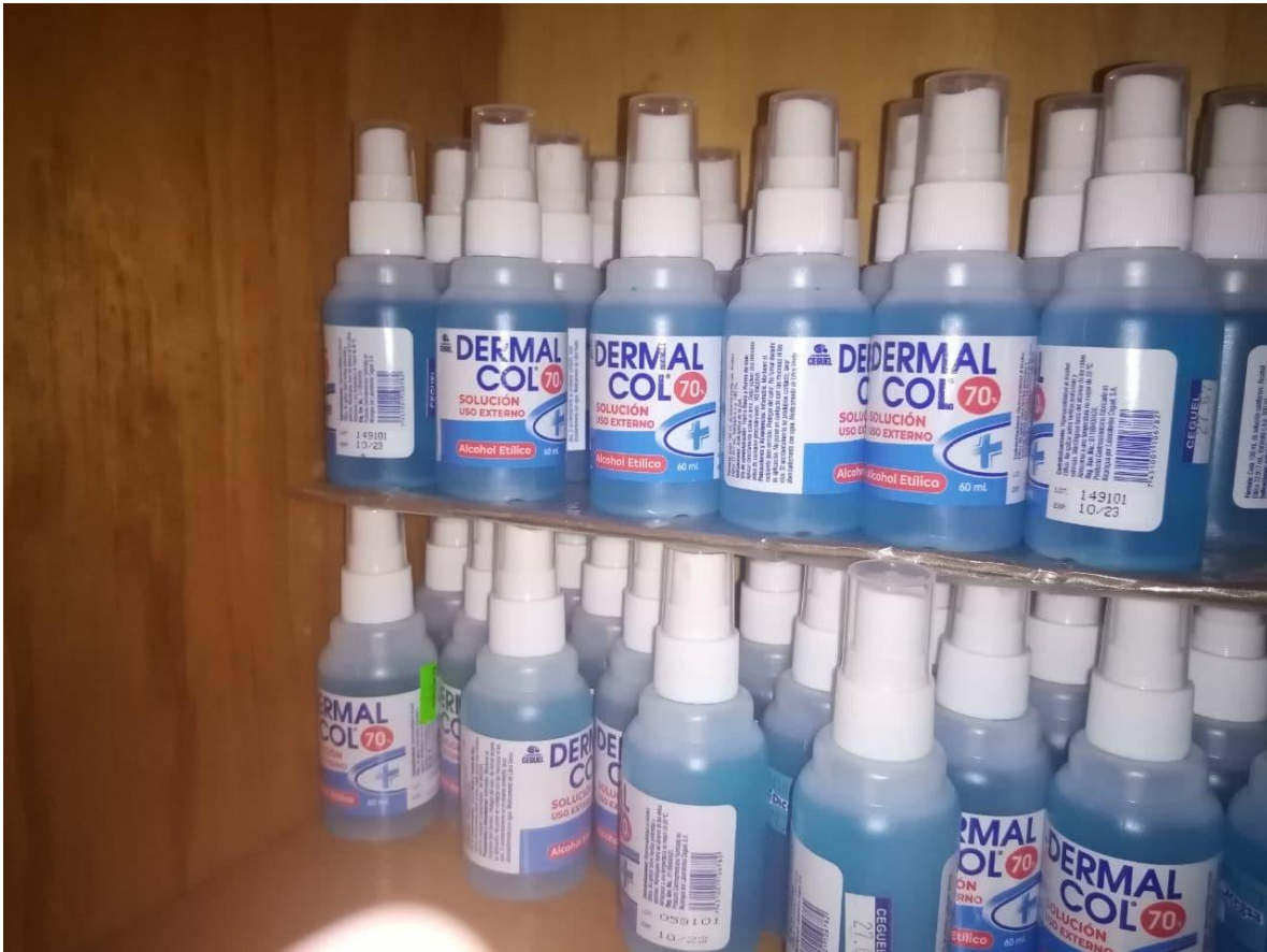
Ilustración 8: Alcohol en presentaciones pequeñas para entregar a participantes en talleres