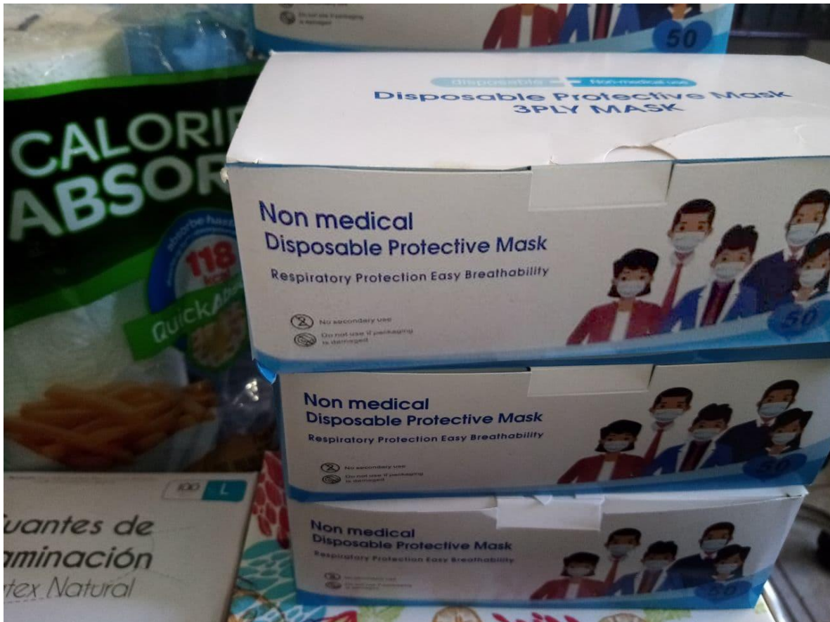
Ilustración 1: Mascarillas para niños